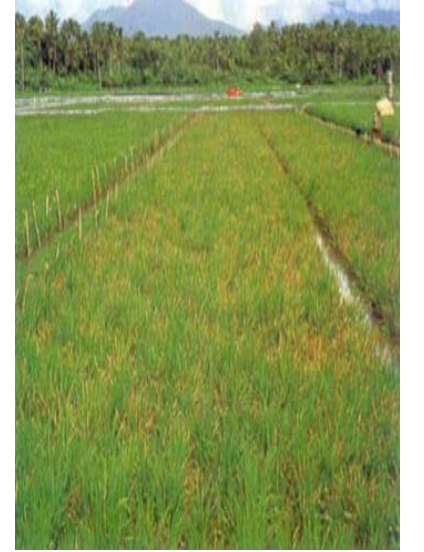
সবুজ পাতাফড়িং আক্রান্ত ক্ষেত